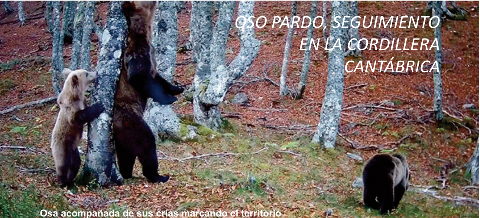
Osa acompañada de sus crías marcando el territorio

Pocos cambios respecto de la evolución que se viene observando a lo largo de los últimos años. Continúa la notable diferencia entre la evolución positiva del área occidental y la negativa en la oriental.