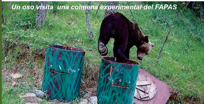
Un oso visita una colmena experimental del FAPAS

Solo las ONG hemos buscado la alternativa de tratar de enmendar el equilibrio roto entre fauna salvaje y sociedad rural. Los políticos siguen optando por el "tiro" como herramienta de solución al problema. Una solución que no merma la cada día mayor presión de los ganaderos contra la fauna salvaje, que aunque disminuya, no impide su presión a través de sindicatos y asociaciones, a sabiendas de que tienen en su mano una herramienta eficaz para doblegar la voluntad de determinados políticos que solo desean seguir en el cargo para mantener su sueldo.