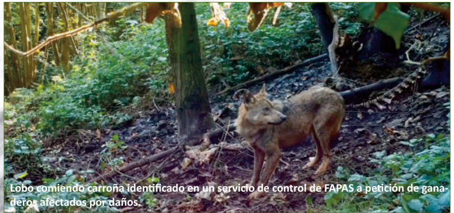
Lobo comiendo carroña identificado en un servicio de control de FAPAS a petición de ganaderos afectados por daños.

Es un trabajo independiente, que sabemos no gusta a las administraciones, pero que soluciona conflictos poniendo la realidad encima de la mesa. Que nos permite valorar el enorme fraude que también hay entorno a las reclamaciones de daños. Al uso exagerado de estos y los intereses que generan en la propia administración o sindicatos que lo utilizan como herramienta política.