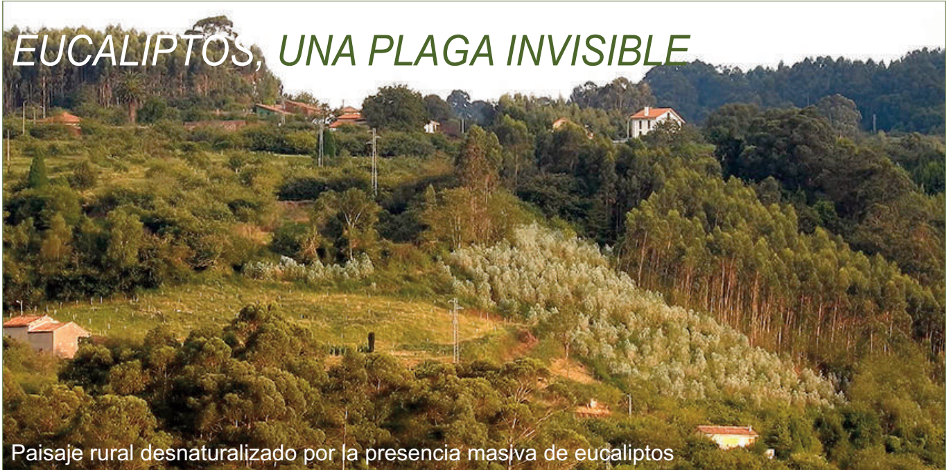
Paisaje rural desnaturalizado por la presencia masiva de eucaliptos

Cangrejos americanos, plumeros de la Pampa, mejillones Cebra, mosquitos invasores y un montón de especies extrañas a la flora y la fauna ibérica han generado durante las últimas décadas una gran alarma, dando lugar a costosos programas de erradicación que la mayoría de las veces no obtienen éxito.