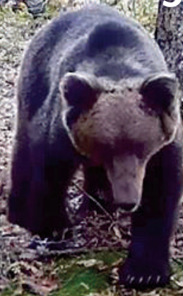
Oso pardo fotografiado en una propiedad de FAPAS

Pero la información es peligrosa si no se puede controlar como sucede con FAPAS.